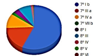
Distribuição por Artigos